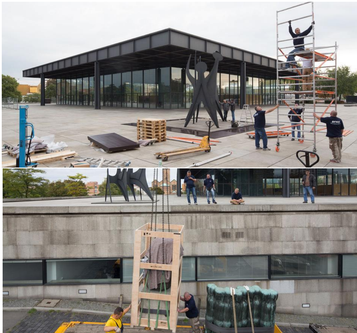
Berlin - Neue Nationalgalerie - Mies Van der Rohe

La didattica sarà strutturata con un certo numero di lezioni e seminari che indagheranno i principi teorici da porre a fondamento delle scelte e gli exempla riconosciuti di intervento sul patrimonio della modernità e la attribuzione di nuovi significati nella cultura contemporanea. Per lo svolgimento della esercitazione pratica, verranno individuati oggetti che, a prescindere da discriminazioni cronologiche, rientrino nella più ampia area della architettura moderna, laddove la trasmissione di valori legati alla cultura architettonica è affidata a una materia talvolta più fragile di quello che ci si aspetta.